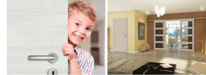
Innentüren sind wichtige Stilelemente einer Wohnraumgestaltung